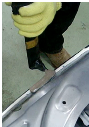
自動車ドアの樹脂硬化加熱